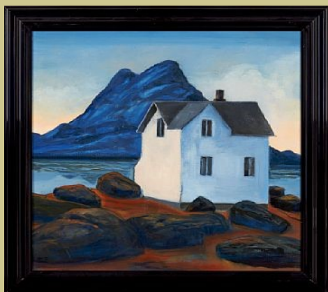
«Henriette-huset» og Stavøya

Parchi Letterari er et nettverk av små lokalsamfunn hvor man kan oppleve unike landskap, historier og tradisjoner beskrevet i litteratur og poesi.